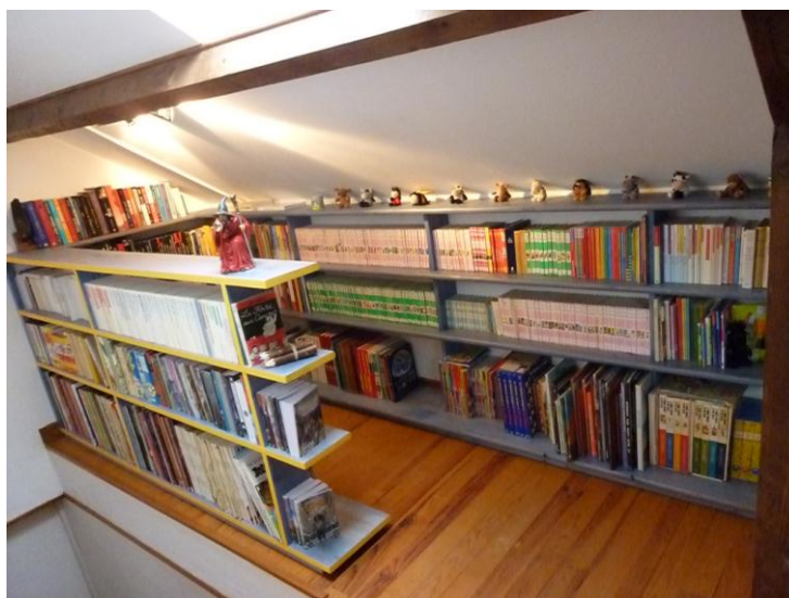
La bibliothèque d'enfance de Claire