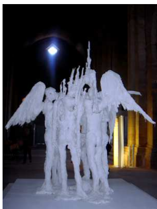
David Altmejd Sans titre