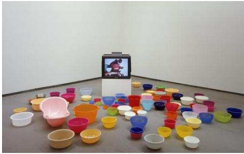
Fabrice HYBER POF n°73 : gigognes , 1997