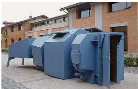
Atelier Van Lieshout Tampa skull , 1998

« À l'épreuve du feu » réunit un ensemble d'œuvres contemporaines où le recours au métal, à l'image du feu, à la représentation des armes et de l'érosion, évoque à la fois le désordre et le chaos mais aussi le principe régénérateur de ces éléments pour une potentielle évolution.