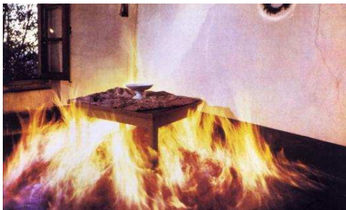
Bernard FAUCON La chambre qui brûle, 1983