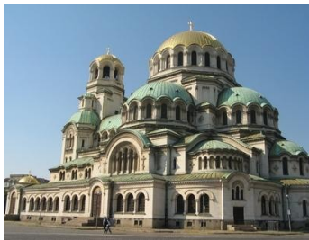
la cathédrale Nevski