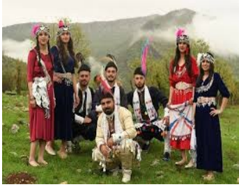
le costume traditionnel