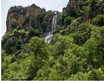
la cascade Siby