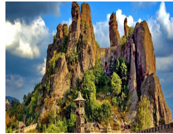
la grotte de Magoura