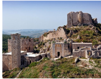
le château de Saladin