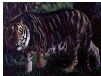
le tigre noir