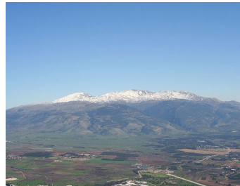
le mont Hermon