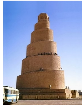
la mosquée de Samarra