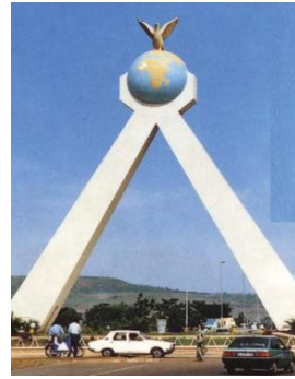
le monument de la paix