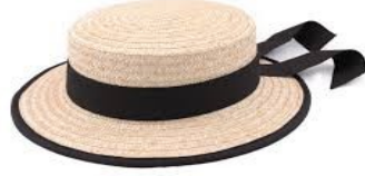
Le chapeau de gondolier