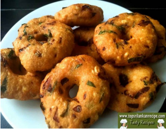
les ulundu vadai