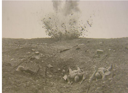
Verdun, visions d'Histoire de Léon Poirier

Dédié à « tous les martyrs de la plus affreuse des passions humaines, la guerre », Verdun, visions d'Histoire se présente comme le récit circonstancié de la célèbre bataille qui fit plus de 200 000 morts entre février et octobre 1916. Mais il ne s'agit pas d'un simple reportage. Léon Poirier inscrit dans la grande histoire le destin de personnages symboliques choisis de part et d'autre du front