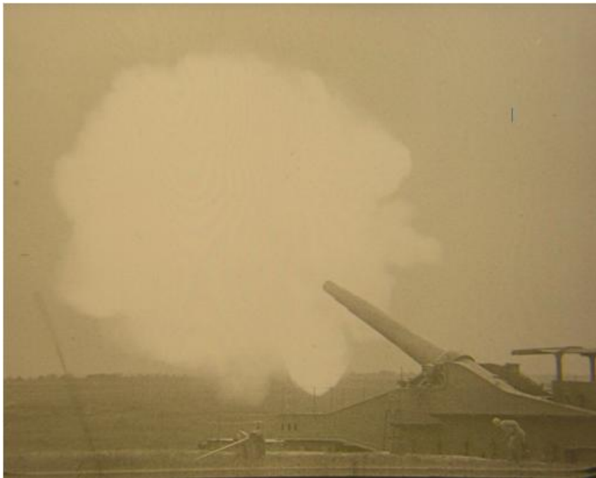
Verdun, visions d'Histoire de Léon Poirier