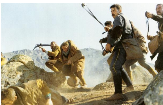
Capitaine Conan de Bertrand Tavernier

Au moment où la Première Guerre mondiale éclate, le cinéma a vingt ans à peine. C'est un art jeune, encore muet, dont le langage propre se constitue peu à peu. En raison de sa capacité à enregistrer et à reproduire le réel, il est sollicité pour rendre compte de ce conflit mondial, dont le nombre de victimes sera sans précédent - 10 millions en quatre ans. Guerre moderne (de par les moyens militaires et les techniques de combat employés) filmée par un médium moderne, la Première Guerre mondiale voit se multiplier les premiers journaux et actualités filmés, instruments de propagande pour influencer l'opinion publique. La fiction a ensuite pris le relais. Malgré l'éloignement temporel, le souvenir de la Grande Guerre est resté vivace. Le traumatisme et l'horreur qu'elle a engendrés