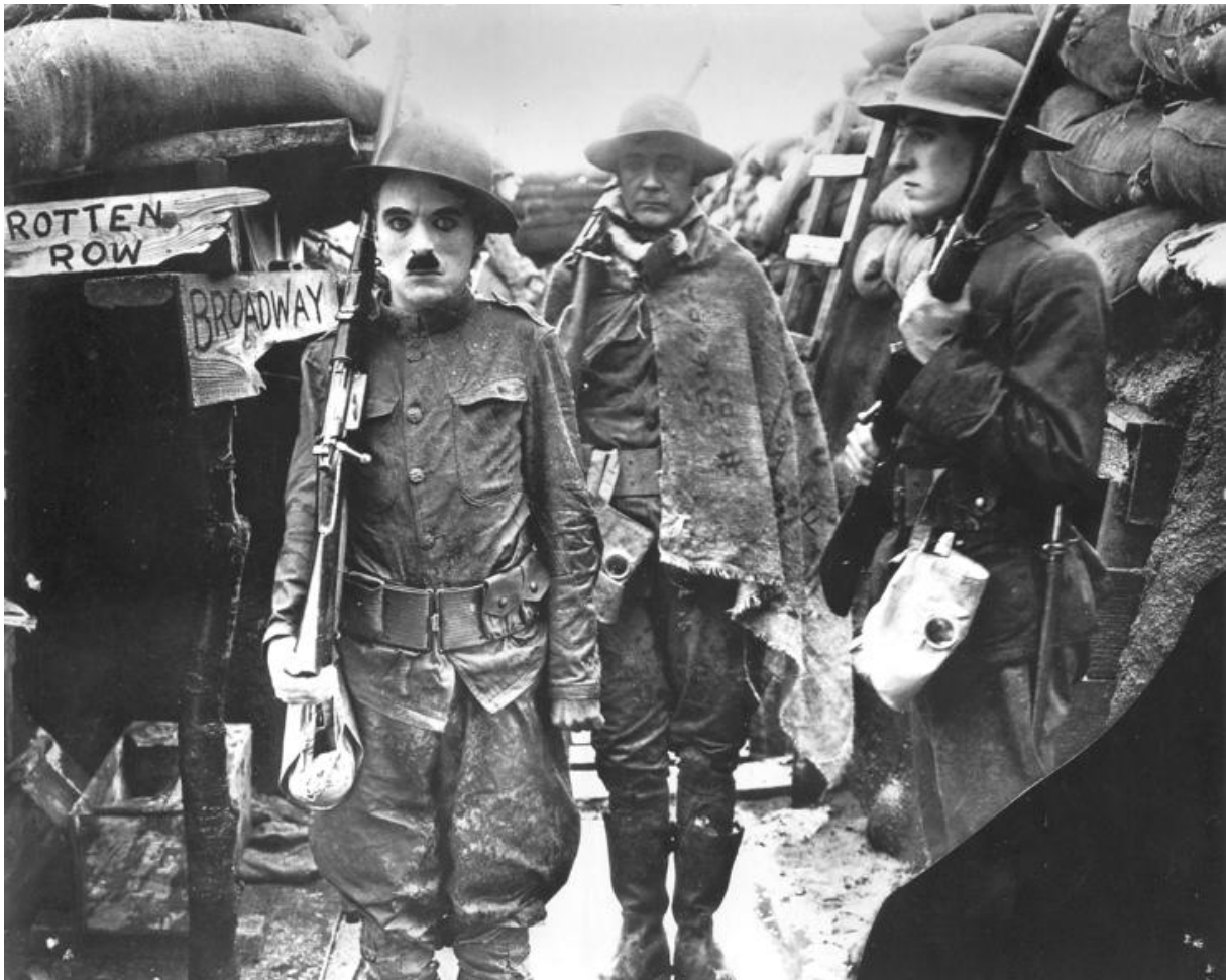
Charlot Soldat de Charles Chaplin