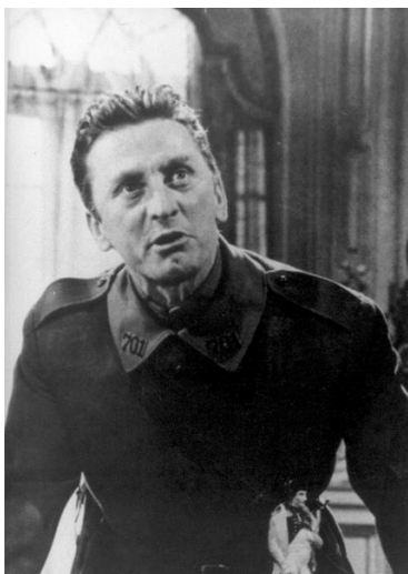
Les Sentiers de la gloire de Stanley Kubrick

« Les sentiers de la gloire ne mènent qu'à la tombe » : ce vers tiré d'un poème de Thomas Gray servit de titre à un roman d'Humphrey Cobb publié en 1935. Il relatait un procès intenté à l'armée française par des veuves de guerre. Stanley Kubrick s'en est inspiré pour raconter comment un général français décide une offensive impossible en 1916, alors que le conflit s'est enlisé. Repoussé par le feu ennemi, le régiment se replie. Le général fait porter la responsabilité à la lâcheté des soldats français et fait fusiller trois hommes pour l'exemple.