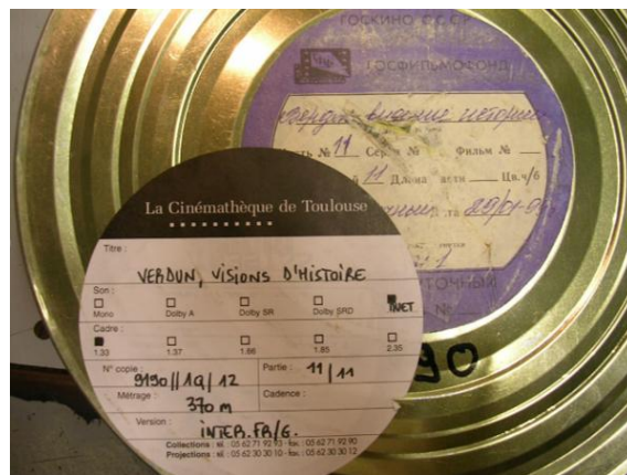
Bobine de Verdun, visions d'Histoire retrouvée par la Cinémathèque de Toulouse

La Première Guerre mondiale occupe une place particulière dans nos collections. Deux films de fiction majeurs abordant la Grande Guerre ont été retrouvés, puis restaurés par la Cinémathèque de Toulouse : Verdun, visions d'Histoire (Léon Poirier, 1928) et La Grande Illusion (Jean Renoir, 1937) font donc partie de la sélection de films proposés aux élèves dans le cadre du Centenaire de la Première Guerre mondiale, aux côtés de La Vie et rien d'autre ou Les Sentiers de la gloire .