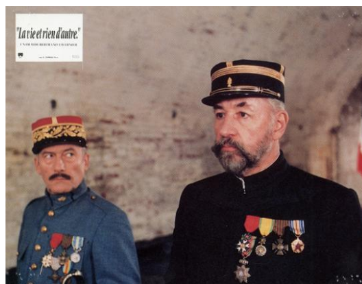
La Vie et rien d'autre de Bertrand Tavernier Collections de la Cinémathèque de Toulouse