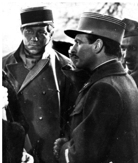
La Grande Illusion de Jean Renoir