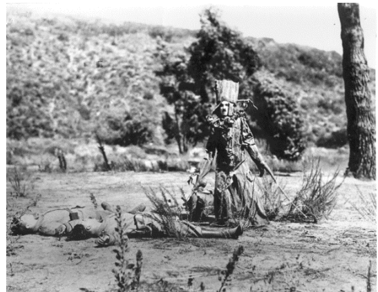
Charlot soldat de Charles Chaplin