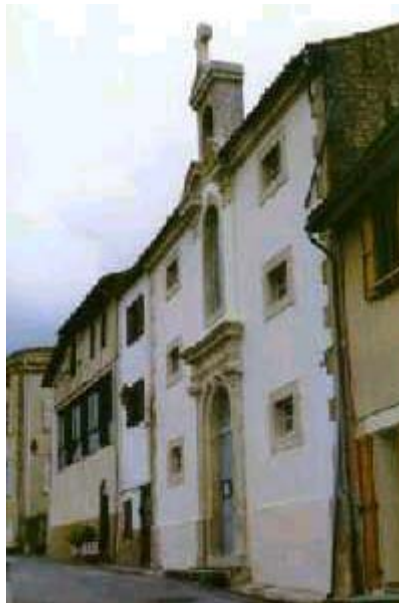
Le Temple du Carla-Bayle - Ariège

" Premièrement, que la mémoire de toutes choses passées d'une part et d'autre, depuis le commencement du mois de mars 1587 jusqu'à notre avènement à la couronne et durant les autres troubles précédents et à leur occasion, demeurera éteinte et assoupie, comme de chose non advenue . Et ne sera loisible ni à nos