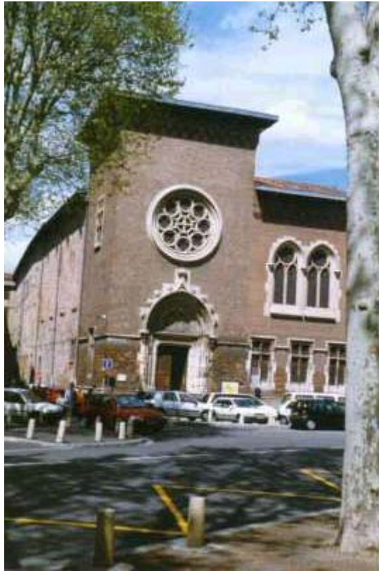
Temple, place du Salin, Toulouse.