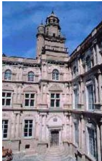
L'Hôtel d'Assézat, Toulouse.

Pierre d'Assézat ( début 16ème siècle - 1581). Ce riche pastelier, en relation avec Pampelune, La Rochelle, Anvers, l'Angleterre, l'Ecosse, est célèbre par l'hôtel particulier qui porte son nom. Il fut capitoul en 1552 et 1561, mais il fut poursuivi par le Parlement de Toulouse comme réformé. Poursuivi après la Saint-Barthélémy, il fut emprisonné à Bordeaux où il abjura le 30 septembre 1572. Il regagna Toulouse et ne fit plus parler de lui.