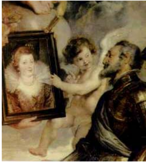
Portrait d'Henri IV par Rubens, Musée du Louvre.

Il est appliqué sous le règne d'Henri IV, et confirmé après son assassinat par Marie de Médicis. Mais le statut dérogatoire des protestants est ressenti comme provisoire par les catholiques qui veulent la réunion des deux confessions.