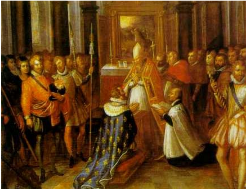
"Abjuration d'Henri IV" à la Basilique Saint-Denis le 25 Juillet 1593. Anonyme, Musée du Château de Pau.

Concrètement, ce sont quatre textes législatifs