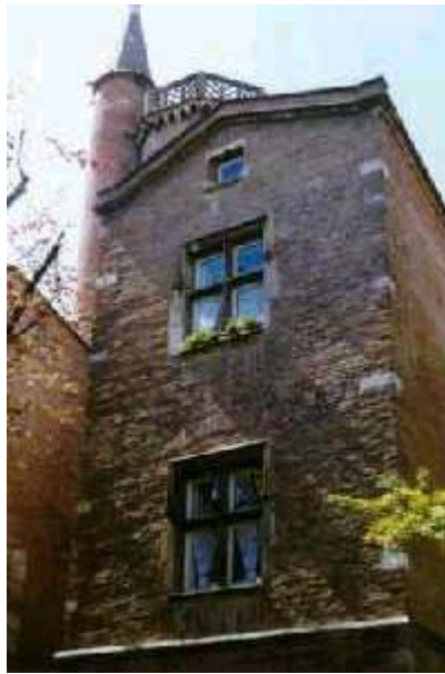
L'Hôtel de Bernuy