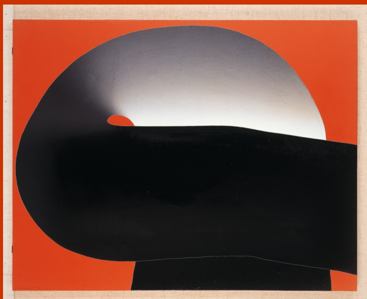
MOTONAGA Sadamasa, Work (Red, Black) , 1970, Huile sur toile, 91,8 x 116,8 cm Collection of Hyogo Prefectural Museum of Art ©The Estate of Motonaga Sadamasa

Gutai, L'espace et le temps présente des œuvres principalement prêtées par le musée départemental du Hyogo, d'artistes du groupe Gutai actif de 1955 à 1972. Sont présentés également des documents, des photographies d'actions, des films, des livres et des brochures permettant de saisir la genèse et la quintessence de cet art imaginatif et révolutionnaire.