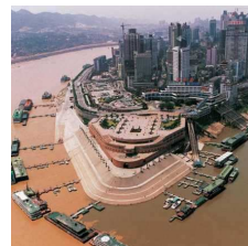
Photo 9, 10 et 11: présentations de différents paysages (situation déclenchante)

Nous avons ensuite demandé aux élèves comment ils pourraient faire pour mesurer la pollution : recueil des idées des enfants à l'oral (trace écrite effectuée par la suite). Nous leur avons montré divers type d'appareils permettant d'évaluer cette pollution, mais ils sont très coûteux et compliqués (Annexe 3). Nous leur avons présenté peu à peu la possibilité d'évaluer ce paramètre via des organismes vivants : animaux ou végétaux. Nous les comparons aux humains : personnes asthmatiques plus sensibles à la pollution.