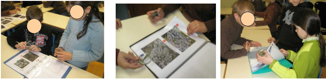
Photo 20, 21 et 22 : Identification des lichens à l'aide des classeurs

Les élèves manipulent les inclusions : ils doivent retrouver et identifier le lichen qu'ils ont entre les mains, à partir des classeurs. Ils se font passer les lichens une fois qu'ils les ont identifiés. Tous les élèves se prennent au jeu. L'identification des lichens via le classeur ne semble pas leur poser trop de problèmes.