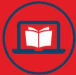
PRATIQUES ET INGÉNIERIE DE LA FORMATION