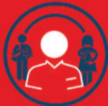
CONSEILLER PRINCIPAL D'ÉDUCATION