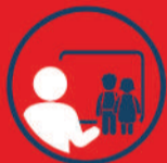
PROFESSEUR DES ÉCOLES