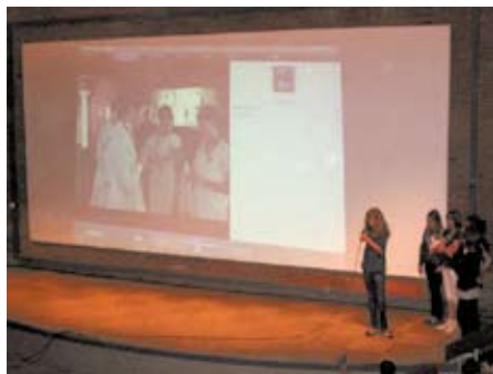
Le forum antique 2008.

Il aura lieu le mercredi 27 mai 2009, de 14 h à 16 h 30 à la salle du Sénéchal (17 rue de Rémusat) et sera suivi d'une visite-goûter au musée. Si vous souhaitez faire participer vos classes, merci de nous soumettre vos projets.