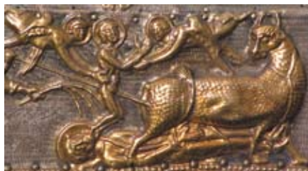
Le martyre de Saturnin sur un reliquaire conservé dans le trésor de Saint-Sernin.