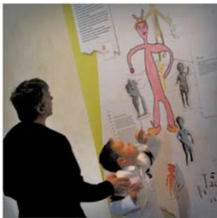
L'exposition Libellus .