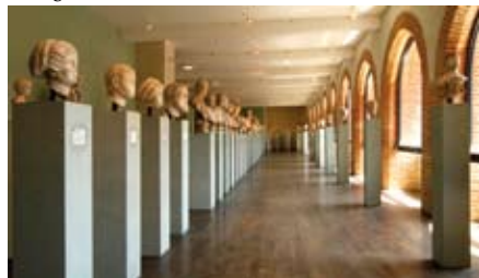
La galerie des portraits romains.