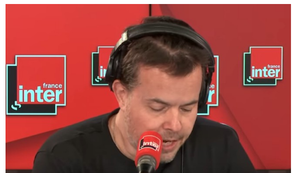
Nicolas Demorand "lisant" son texte lors d'une matinale de France Inter.

Constat : La plupart de ce qui est dit à la radio est écrit même si nous n'avons (presque) jamais l'impression que c'est lu !