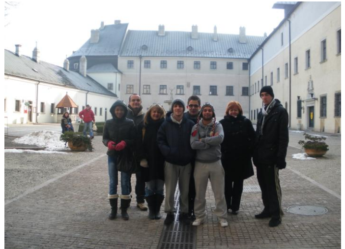
Le Château de « Pierres rouges »