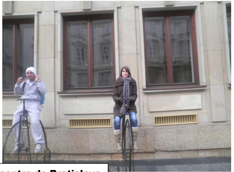
Visite du centre de Bratislava