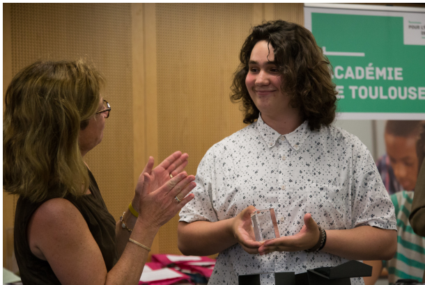
Madame la Rectrice remet le trophée de l'Académie, groupement Sciences et Technologies