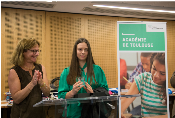
Madame la Rectrice remet le trophée de l'Académie, groupement E.S et L.