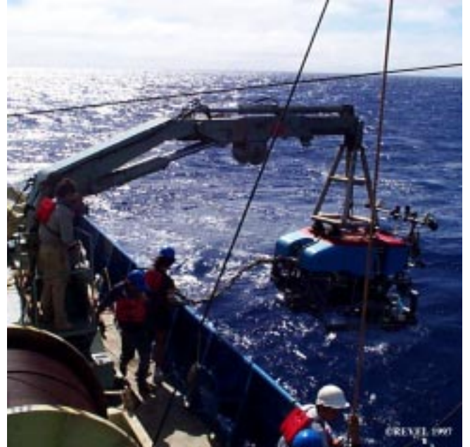
immersion du robot "Jason", celui qui a découvert l'épave du "Titanic"

A plus de 2000 m. de profondeur, il y a des raies, certains poissons, des crabes araignées, des vers vestimentifères ; il y a aussi des bactéries.