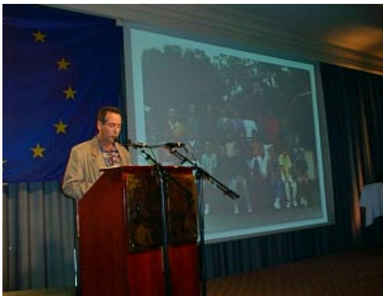
discours (en anglais !) devant les 300 invités de cette manifestation

la nouvelle carte de France Télécom tirée à 1 000 000 d'exemplaires