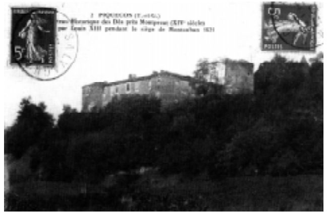
une ancienne carte postale présentant le château de Piquecos