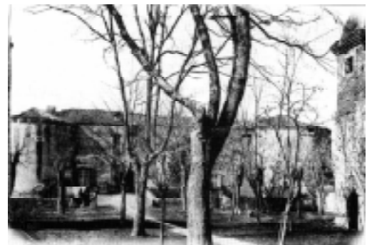
le château vu depuis le parc