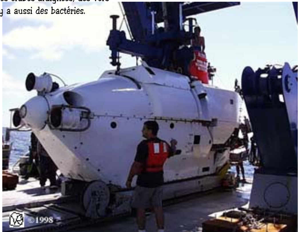
le sous-marin américain "Alvin"