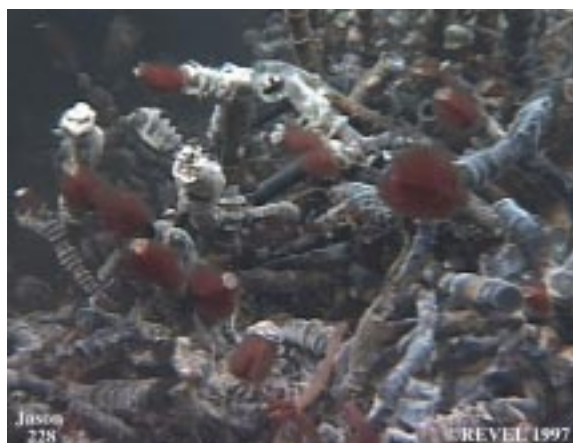
de la vie à 2 000 m. de profondeur : vers vestimentifères

Les volcans apparaissent le long des plaques tectoniques, aussi bien sur terre qu'au fond des océans.