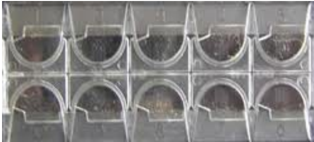
Photo d'une lame de Kova

Le volume d'1 petit carré est de 0,01 \mu L.