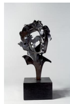
Pablo Gargallo (1881-1934) Hommage à Chagall , 1933 Bronze, HC, Dépôt fonds Gargallo, 2019