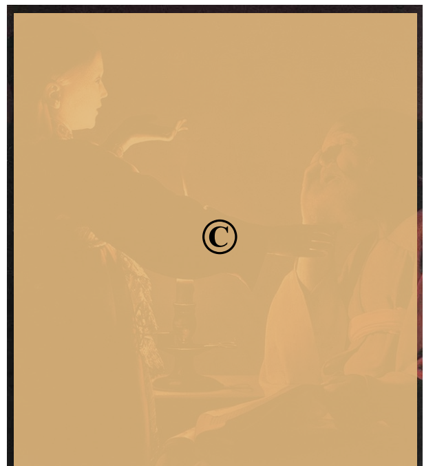
Georges DE LA TOUR, Apparition de l'ange à saint Joseph, vers 1600-1650, huile sur toile, 93 x 81 cm.