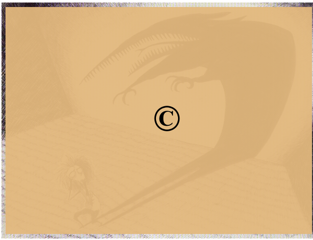
Tim BURTON, extrait du story-board Vincent. 1982. Dessin.