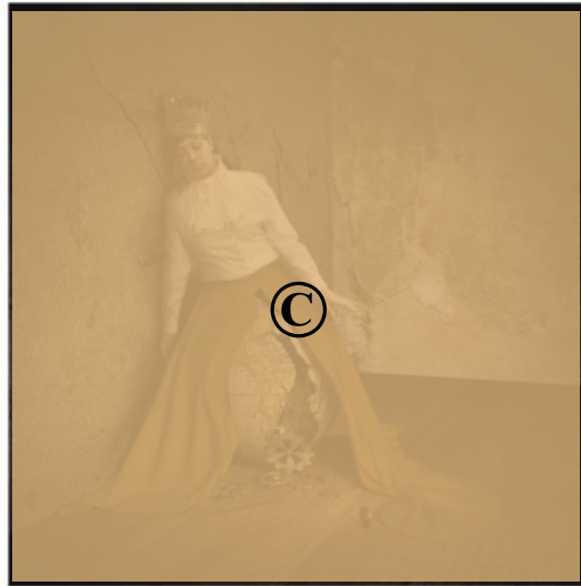
Jamie Baldridge. My Steady World, 2007, photographie.