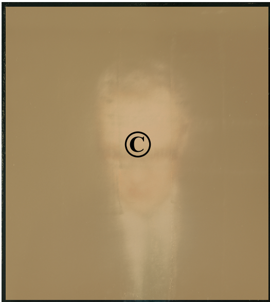
Gerart RICHTER, Autoportrait, 1996, huile sur toile.