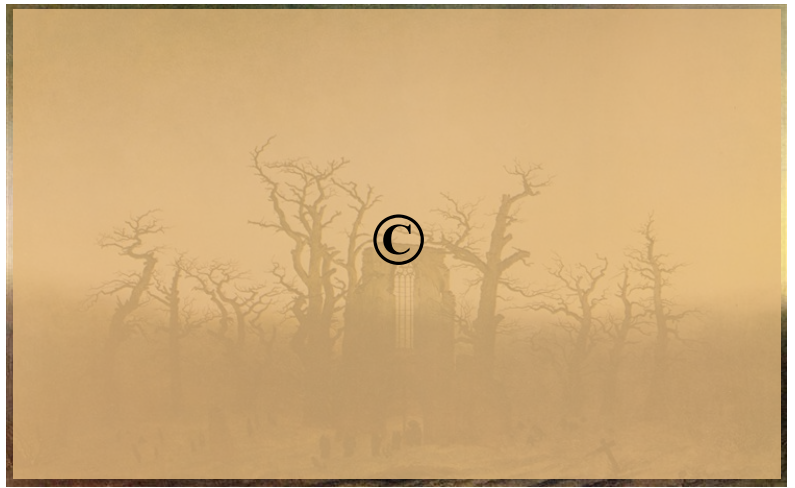
Caspar David FRIEDRICH, L'abbaye dans une forêt de chêne, 1810, huile sur toile.