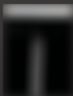
André MARFAING Sans titre 1982 Lavis encre de chine sur papier

1- Observe bien les œuvres des artistes que je vous ai présenté en classe.