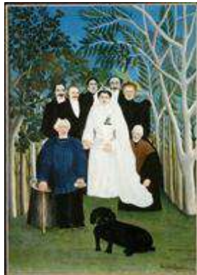
Rousseau Henri, Le Douanier Rousseau (dit) (1844-1910) La noce Musée de l'Orangerie, Paris Format original : H : 163 X L : 114 cm

Format de la bâche (n° 110 + n° 122) : H : 104 X L : 86 cm