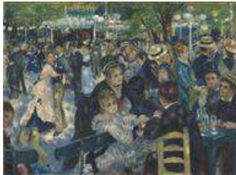
Renoir Auguste (1841-1919) Bal du Moulin de la Galette, Montmartre Musée d'Orsay, Paris Format original : H : 210,7 X L : 285 cm

Format de la bâche (n° 2) : H : 210,7 X L : 285 cm