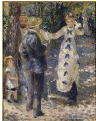
Renoir Auguste (1841-1919) La balançoire Musée d'Orsay, Paris Format original : H : 92 X L : 73 cm

Format de la bâche (n° 2) : H : 210,7 X L : 285 cm