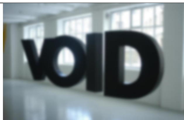
Christian ROBERT-TISSOT, VOID, 2005, polystyrène, acrylique, câbles, moteurs, 100x580 cm