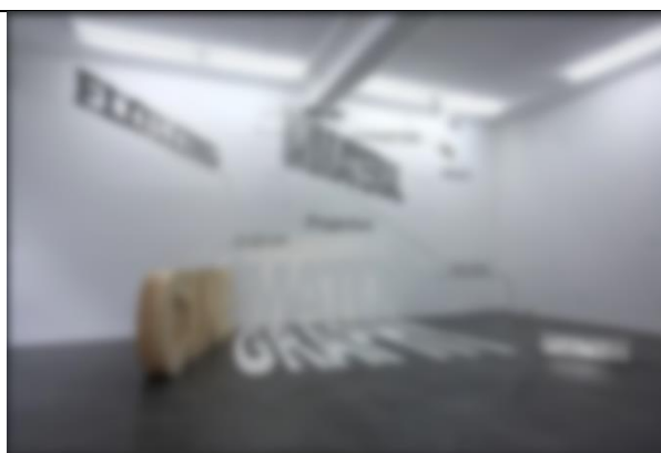
Jan MANCUSKA, Notion in Progress, 2010, bois, peinture, métal, parquet, caisson lumineux, projection, dimensions variables