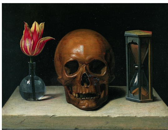
Philippe de Champaigne, Vanité, 1644