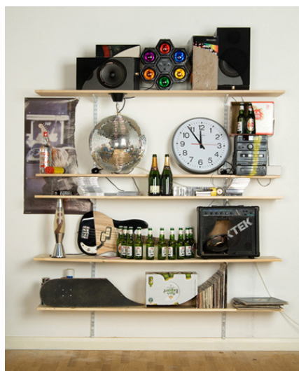
James Hopkins, Wasted Youth, 2006.