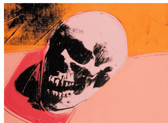
Andy Warhol, Skull, 1976