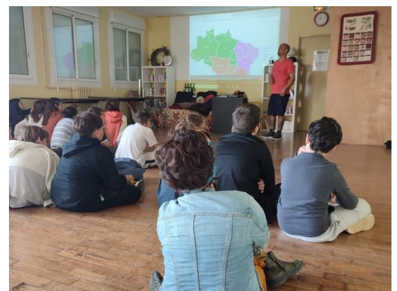
La forêt amazonienne avec les 6 ème