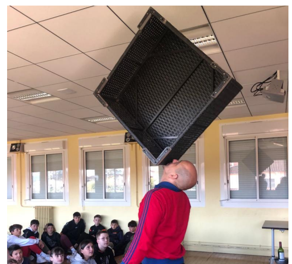
L'équilibre avec les 5 ème