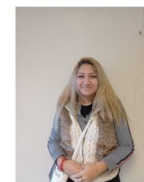
Délia Francophone, Roumain