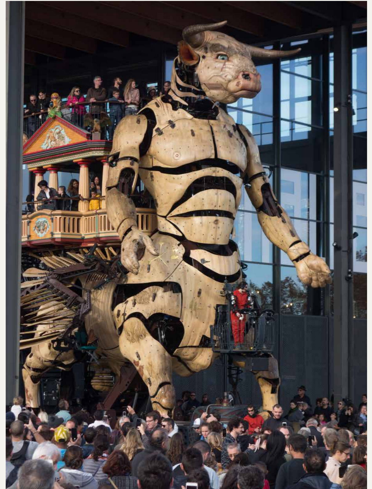
Le Minotaure devant la Halle de La Machine

Au quotidien, cette machine monumentale et singulière embarque du public sur son dos pour des voyages uniques dans le quartier de Montaudran.