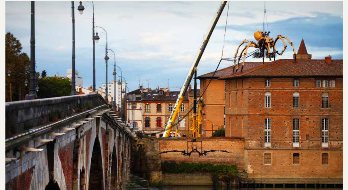
L'Araignée et le Minotaure pendant le spectacle Le Gardien du Temple