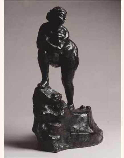
Antoine Bourdelle (1861-1929) Les pommes, 1907