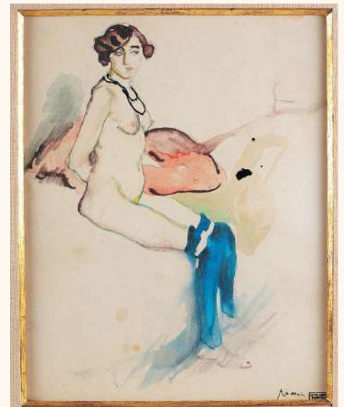
Jules Pascin (1885-1930) Hermine David, 1907