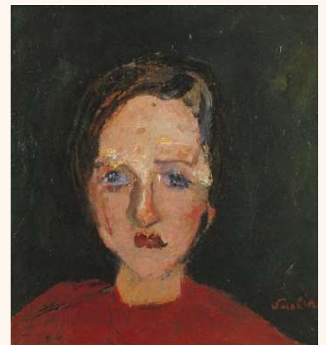
Chaïm Soutine (1893-1943) Portrait de jeune femme en rouge vers 1928