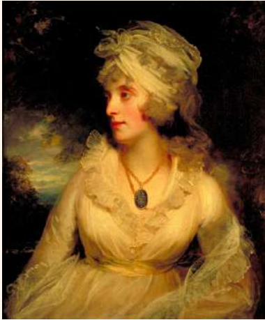
Sir William Beechey (1753 -1839) Portrait d'une lady, vers 1795

Galerie de portraits dans la collection Simonow (florilège)