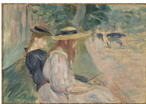
Berthe Morisot (1841-1895) Sur un banc au bois de Boulogne 1894 Huile sur toile Paris, musée d'Orsay Legs Nadia Boulanger, 1980