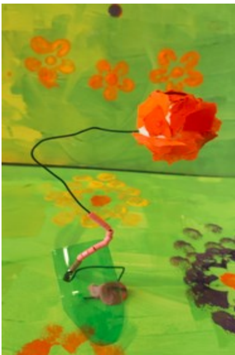
École de Labatut Rivière