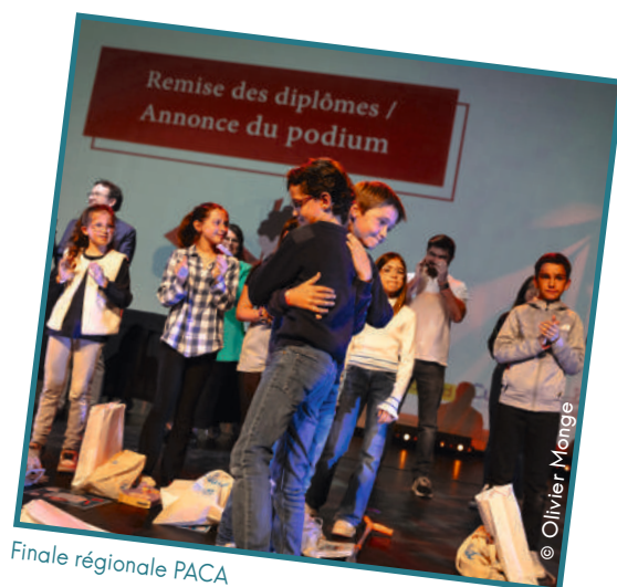
Finale régionale PACA