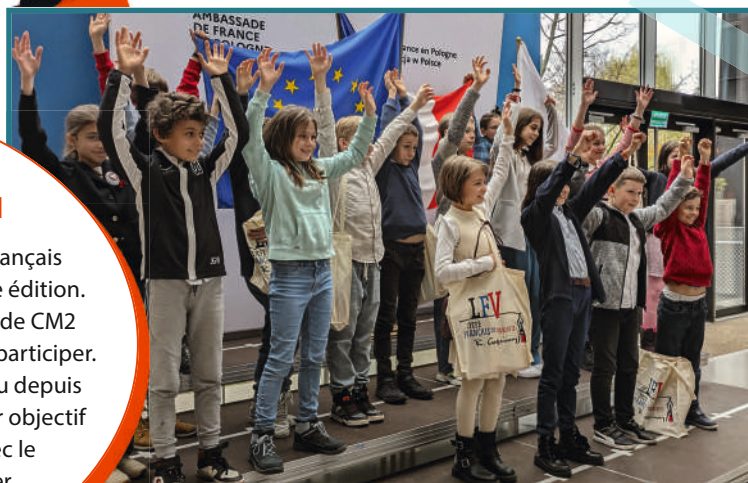
Remise de diplômes, finale à l'Ambassade de France à Varsovie

Le jeu s'est ouvert aux établissements français à l'étranger d'Europe lors de la précédente édition. Cette année, toutes les classes de CM1 et de CM2 du réseau AEFÉ du monde entier pourront participer. Une grande première dans l'histoire du jeu depuis sa création en 2012 ! Cette initiative a pour objectif de partager le plaisir de la lecture avec le plus grand nombre d'élèves et créer une aventure collective centrée sur la francophonie.