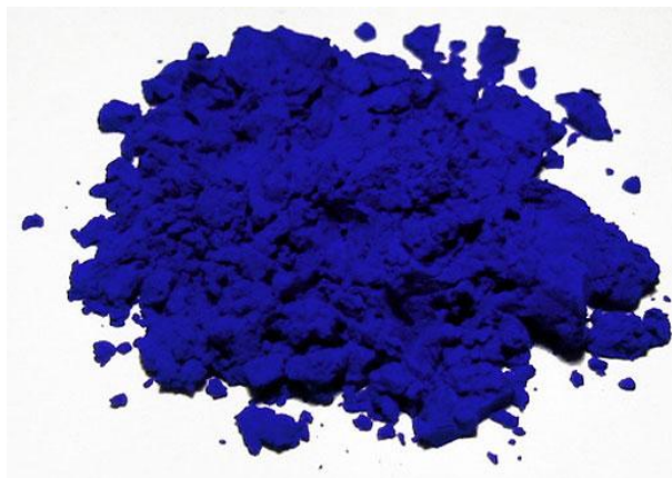
Yves Klein , Venus bleue , 1962, Pigments IKB et collage d'éponges imbibées de pigments bleus