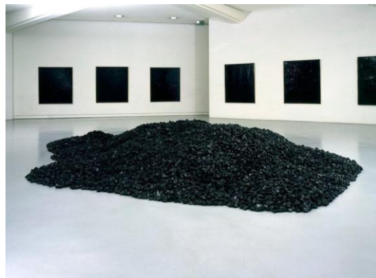
Tas de charbon, 2023