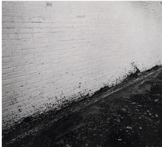
Richard Serra , Splashing, Éclaboussures , mine de plomb, 1969

Cet artiste va utiliser divers procédés de fabrication industrielle, différentes actions pour réaliser ses œuvres en plomb comme les « Eclaboussures » ( Splashing ) en 1969 où il projette du plomb fondu sur le sol et le mur avant qu’il se solidifie. Le processus de transformation des matériaux occupe une place centrale dans son travail.