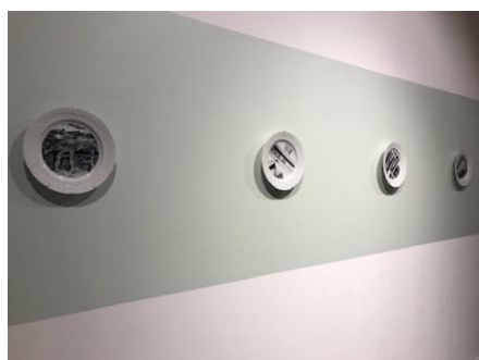
Soupe Grasse 01 02 03 04 Sérigraphies d'émaux sur assiettes à partir de dessins effectués au point par point feutres Staedtler pigment liner noir 0,5, 0,2 et 0,1, réalisation des sérigraphies : Le parti, Grenade (31)