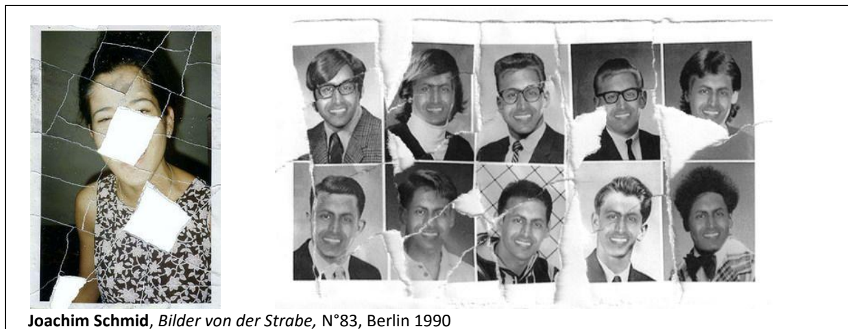
Joachim Schmid, Bilder von der Strabe , N°83, Berlin 1990

Consigne : Exploiter un ou plusieurs fragments d'une image ancienne dans une réalisation plastique (photographie personnelle, de soi, d'un lieu, d'une œuvre d'art, d'un événement de société, d'un journal, d'un livre, d'un texte, d'une affiche...)