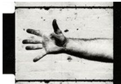
Richard Serra , Hand Catching Lead , film 16mm noir et blanc, silencieux, 3 minutes 1968

La main de Richard Serra tente d'attraper au vol un morceau de plomb jeté dans l'image par un opérateur (Philip Glass) qui reste hors-champ.