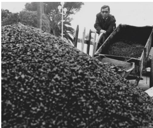
Bernar Venet devant le tas de charbon, Nice, 1963

Sur la route, Bernar Venet tombe sur un tas de gravier mélangé à du goudron posé sur le trottoir pour réparer un défaut de chaussée. Son esprit ne fait qu'un tour : utiliser du charbon pourrait être la solution idéale à tous ses tracas olfactifs liés au goudron. Il retourne à son atelier et commande immédiatement cinq sacs de charbon auprès des ateliers des décors de l'opéra de Nice. Il réalise le tas de charbon en 1963 mais ce n'est qu'en 1975 que l'œuvre imposante a pu être dévoilée au grand public et va bouleverser l'art contemporain.