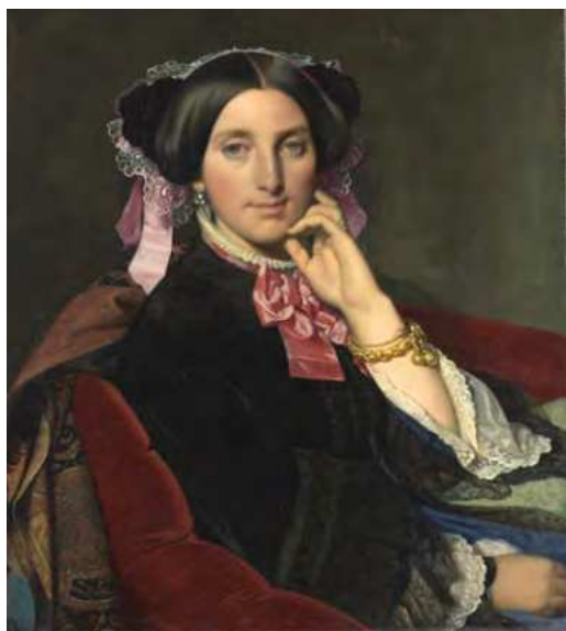
Jean-Auguste-Dominique INGRES Montauban, 1780 - Paris, 1867 Portrait de Madame Gonse, 1852. Huile sur toile

Fiche pédagogique : museeingresbourdelle.com/Scolaires