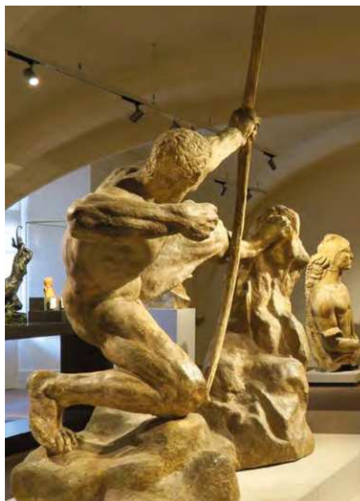
Emile-Antoine BOURDELLE Montauban, 1861 - Le Vésinet, 1929 Héraklès Archer, 1909 Plâtre patiné brun clair

Fiche pédagogique : museeingresbourdelle.com/Scolaires