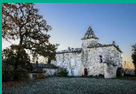
Château-musée du Cayla.