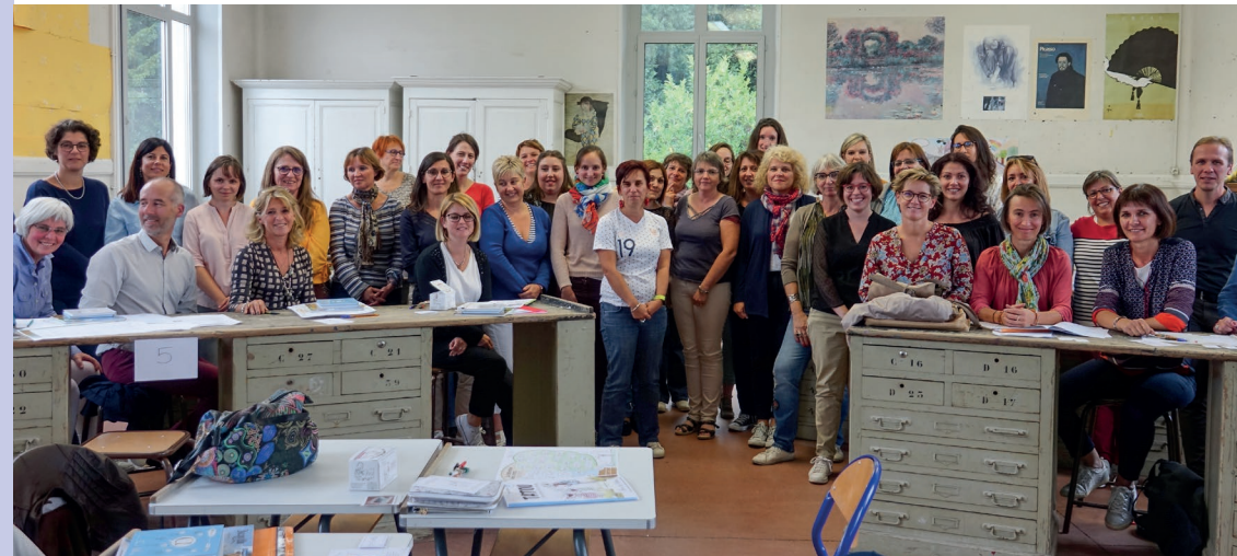
École Charles de Gaulle du Creusot, lauréat 2021.

Le Prix Chercheurs en Actes a été créé en 2019 par le CSEN, Réseau Canopé, le Réseau des INSPE, l'IH2EF, l'IFE et GMF. Il met à l'honneur les initiatives et méthodes portées par des équipes pédagogiques et récompense des actions qui s'appuient sur la recherche, l'expérimentation ou la comparaison internationale. Ces initiatives sont inspirées des travaux de la recherche et tendent à améliorer les connaissances et les compétences de l'élève. Les actions ont été éprouvées en classe et pourront être déployées au sein d'autres établissements.