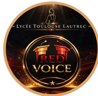
Les Tribuns Solidaires