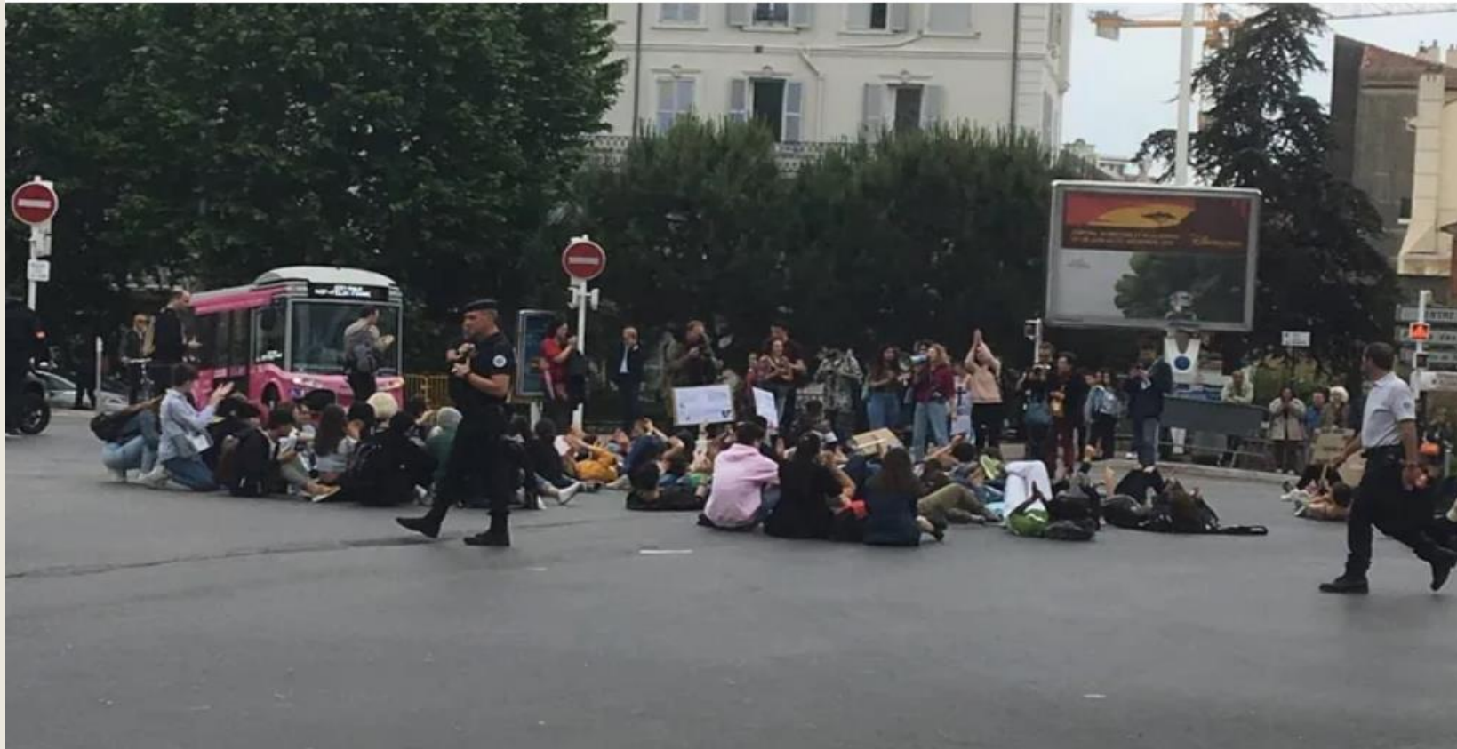
Des jeunes cannois en train de manifester pour le climat lors du Festival de Cannes.