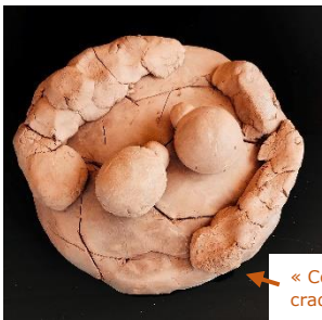
« Contre-tupilak » représentant la banquise craquelée sur laquelle résistent deux igloos

Jérôme Weiss, « Petite tectonique des plaques de banquise », tiré à part, extrait du numéro 1 de la revue Pôles Nord & Sud publiée par Le Cercle Polaire, automne 2008 https://eduscol.education.fr/document/45757/download