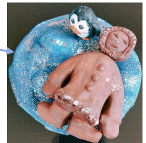
« Contre-tupilak » représentant enfant inuit et un pingouin vivant en harmonie sur la banquise