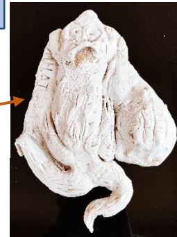
« Contre-tupilak » représentant un animal hybride terrestre et marin