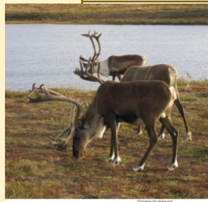
Vladimir Randa, « Le caribou au cœur de la culture Inuit », tiré à part, extrait du numéro 4 de la revue Pôles Nord & Sud publiée par Le Cercle Polaire, été 2017 https://eduscol.education.fr/document/41695/download