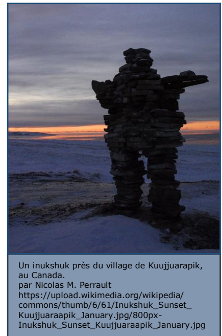
Un inukshuk près du village de Kuujuaarapik, au Canada.