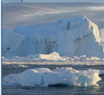
Iceberg géant d'Ilulissat, la capitale des glaces de l'Isfjord https://www.grands-espaces.com/croisieres/groenland-pays-des-icebergs-geants/