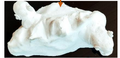
« Contre-tupilak » représentant l'âme de la toundra animée par la végétation fleurie