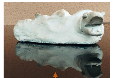
« Contre-tupilak » représentant un iceberg se défendant contre le réchauffement climatique par deux divinités à tête de serpent