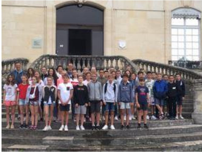
Stage à Font Romeu