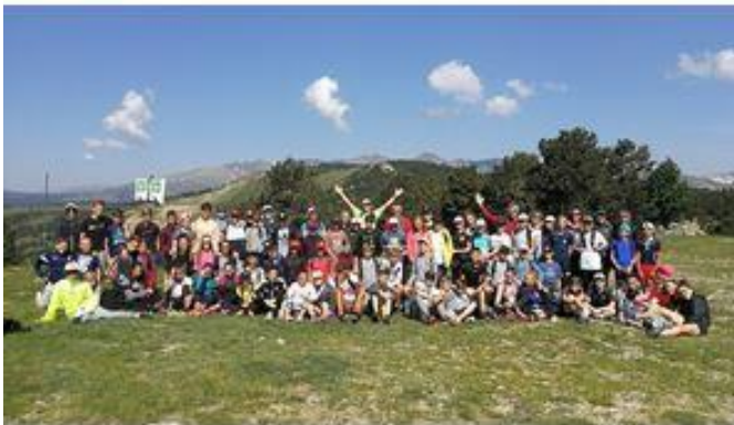
Rencontre avec les ambassadeurs de l'académie

Classe Pierre de Coubertin – Alice Milliat