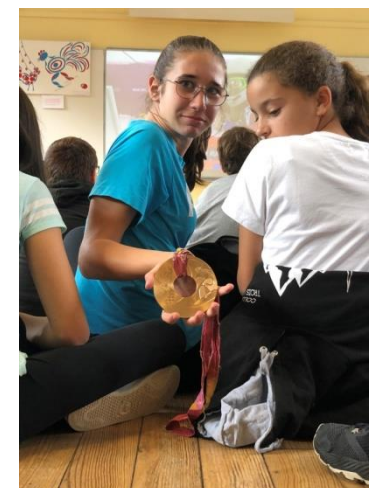
Nahia avec la médaille olympique de Paul-Henri de Le Rue

25 septembre 2019 Rencontre avec un champion olympique Paul Henri de Le Rue