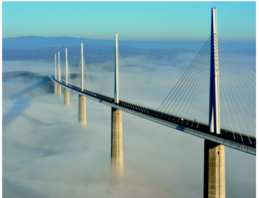
Le viaduc de Millau enjambe le Tarn

Il franchit la vallée du Tarn d'un seul trait. Construit en béton armé et en acier, le viaduc a permis de développer les activités commerciales et industrielles de la région aveyronnaise. Il a également fait en sorte que soient supprimés les longs embouteillages de Millau, augmenté le tourisme et grandi la réputation de la ville.