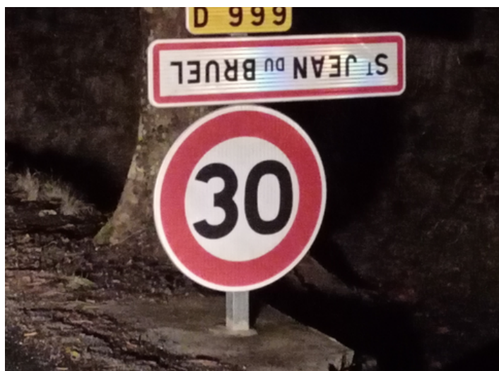
Les panneaux de St Jean-du-Bruel sont à l'envers

On retrouve dans plus de 10 000 communes et villages des panneaux retournés. Le but de l'opération est de dénoncer les politiques agricoles nationale et européenne.