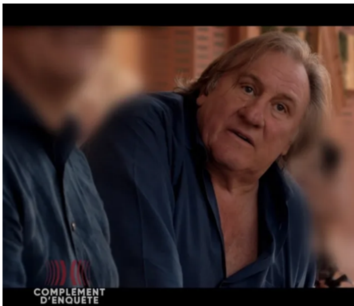
Gérard Depardieu en train de proférer des obscénités à propos d'une jeune fille dans l'émission Complément d'Enquête

À la minute où vous lisez cet article, une femme est en train de se faire agresser, star ou simple citoyenne. Je vais vous révéler les personnes connues qui ont agressé des femmes en 2023 et un numéro à appeler pour en parler.