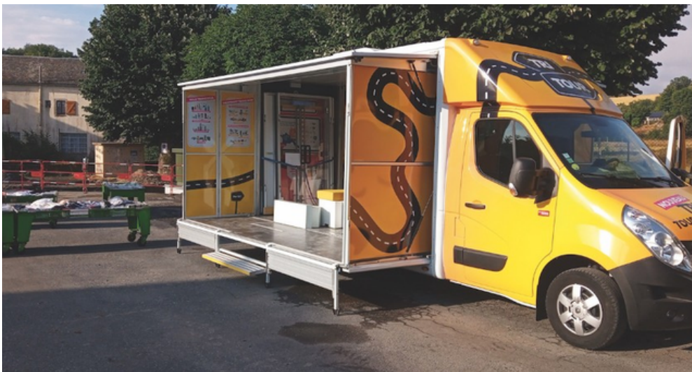
Le camion Tri-Tour à Villefranche de Panat