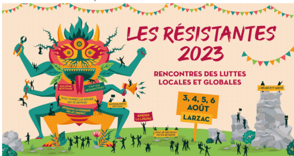
Le festival a eu lieu du jeudi 3 au dimanche 6 août

En 2003 avait déjà eu lieu un événement similaire près de l’autoroute A75 où cette fois-ci plus de 300 000 personnes étaient venues, ce qui était énorme. Donc ce festival a aussi eu lieu pour fêter les 20 ans de cet événement. L’organisation FFS (Festivity Fight Sexism) était présente pour aider à éviter toutes agressions sexuelles et prévenir tout débordement.