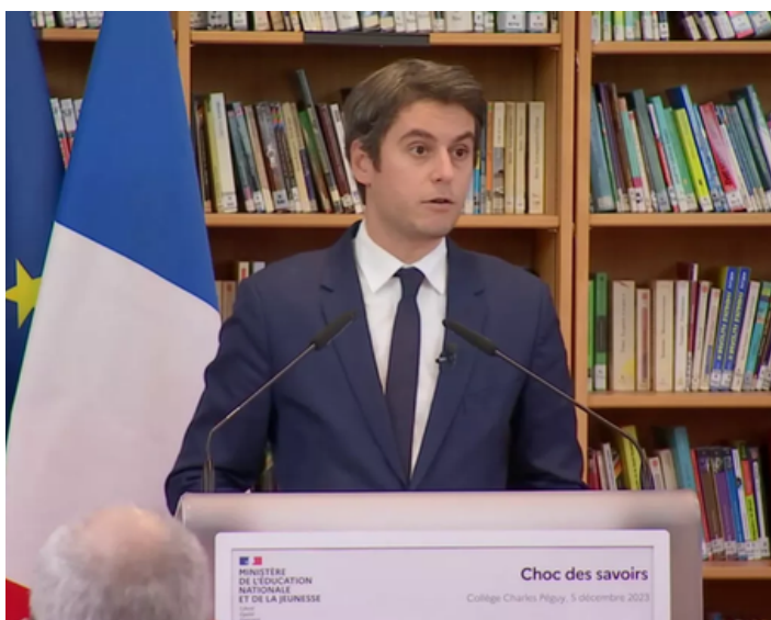
Le paquet de mesures annoncé en conférence de presse

Dans le prochain numéro : la suite des aventures de Gabriel Attal à Matignon