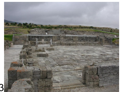
1. El teatro / 2. La basílica / 3. El foro