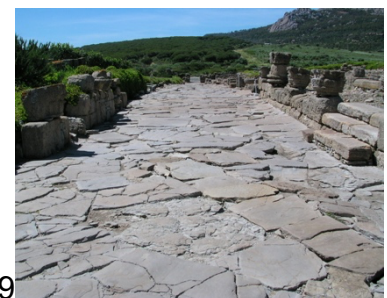
7. Las termas / 8. La domus del Cuadrante Solar / 9. El decumanus maximus