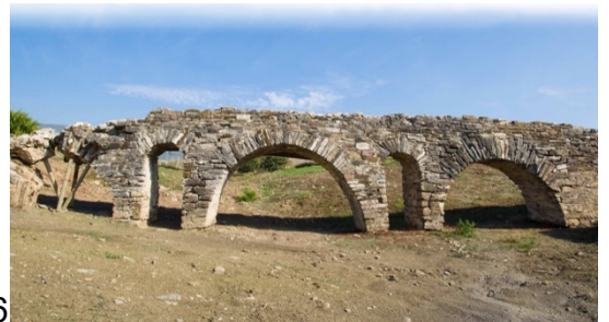
4. El templo de Isis / 5. El mercado (macellum) / 6. El acueducto