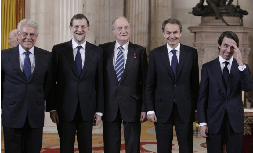
Felipe González; Mariano Rajoy; Juan Carlos I de Borbón; J. L. R. Zapatero y J. M. Aznar