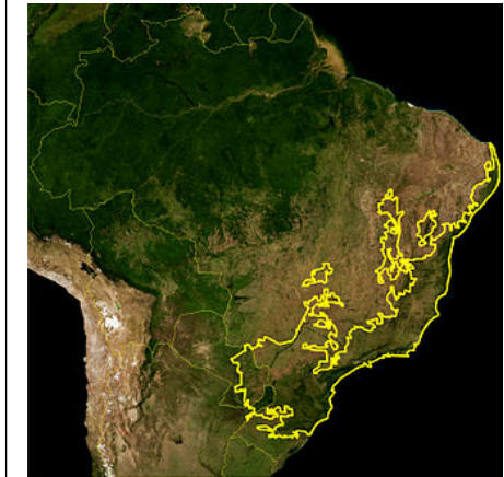
Carte 3 : La « Mata Atlântica » définie par le WWF

« Métropole de Rio de Janeiro : enjeux de la planification et de la mobilité durable », de L'Institut de l'Aménagement et de l'Urbanisme – Île-de-France. Page 6 et 7 http://www.fnau.org/wp-content/uploads/2016/07/nr_723_rio.pdf