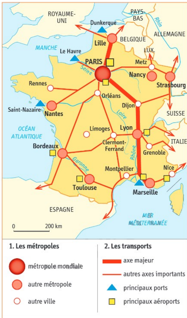
1 Les métropoles et les transports