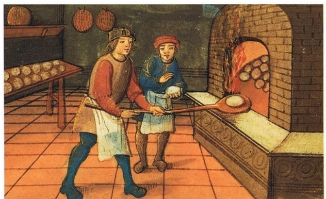
Un boulanger médiéval avec son apprenti (« A medieval baker with his apprentice », image numérique d'une peinture apparu dans Den medeltida kokboken , Wikimedia Commons).