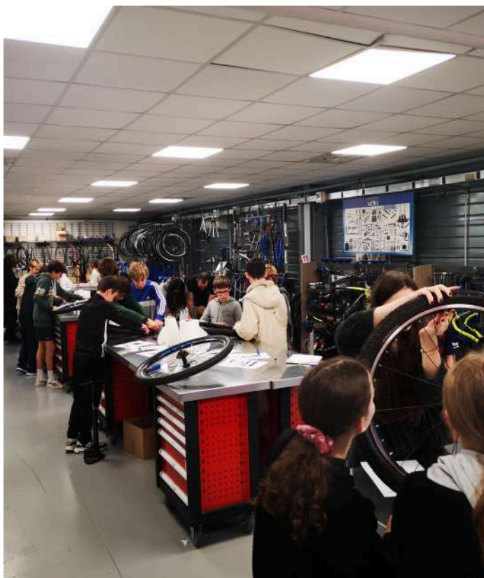
Les élèves de 4e apprennent à réparer un vélo et à changer une roue lors d'un atelier au Véloscope de L'Isle Jourdain.

L'Isle Jourdain est une ville étroitement liée au vélo. Le vélodrome est la preuve d'un ancrage historique. Aujourd'hui, le projet économique VéloPôle visant à développer un bassin d'activités lié au vélo a permis au collège de trouver localement de nombreux partenaires. Les vélos ont été acquis auprès de l'entreprise Cyclelab situés à moins de 500 m du collège et des événements ont été organisés au Véloscope, lieu dédié au vélo avec des espaces propices à la mise en place de nombreux ateliers à destination des élèves.