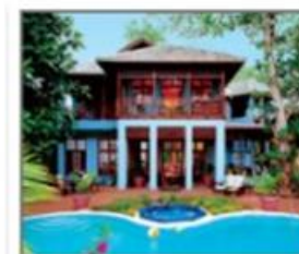
VILLE E VILLINI