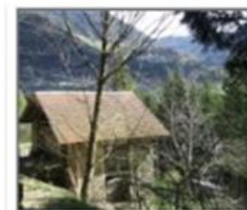
RUSTICI E TERRENI