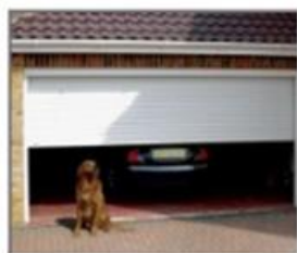
BOX E GARAGE