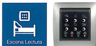
Botonera centralización de funciones

Sus clientes pueden visualizar y modificar la temperatura desde la propia habitación o, si lo prefiere, puede controlarla usted mismo desde recepción.