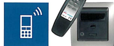
Receptor infrarrojos con mando a distancia