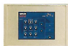
Pantalla táctil empotrable