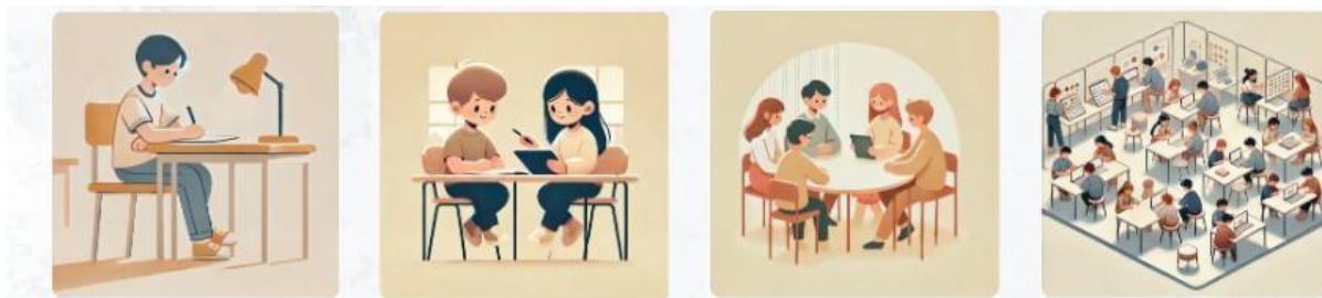
Images générées par DALL-E (intégré à Chat GPT) - Nombre d'images générées par jour limité à 3 (version gratuite)

Ces illustrations constituent également un appui pour l'axe 2 de la différenciation pédagogique, qui vise à adapter l'environnement et les modalités de travail .