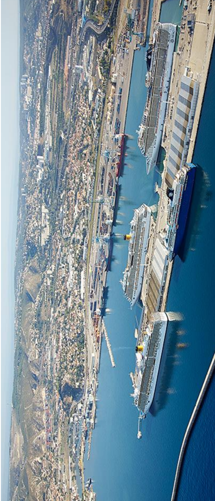
Terminaux portuaires de Marseille ( https://www.marseille-port.fr/fr/Page/13021 )