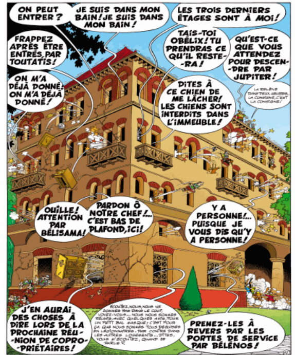
Le domaine des dieux , R. Goscinny et A. Uderzo, 1971

Plurimus hic æger moritur vigilando; sed ilium Languorem peperit cibus imperfectus et hærens Ardenti stomacho : nam quæ meritoria somnum Admittunt? magnis opibus dormitur in Urbe. Inde caput morbi : rhedarum transitus arcto Vicorum in flexu, et stantis convicia mandra Eripiunt somnum Druso vitulisque marinis. Si vocat officium, turba cedente, vehetur Div et ingenti curret super ora Liburno, Atque obiter leget aut scribet, vel dormiet intus; Namque facit somnum clausa lectica fenestra: Ante tamen veniet. Nobis properantibus obstat Unda prior; magno populus premit agmine lumbos Qui sequitur; ferit hic cubito, ferit assere duro Alter; at hic tignum capiti incutit, ille meretram, Pinguia crura luto; planta mox undique magna Calcor, et in digito clavus mihi militis hæret.