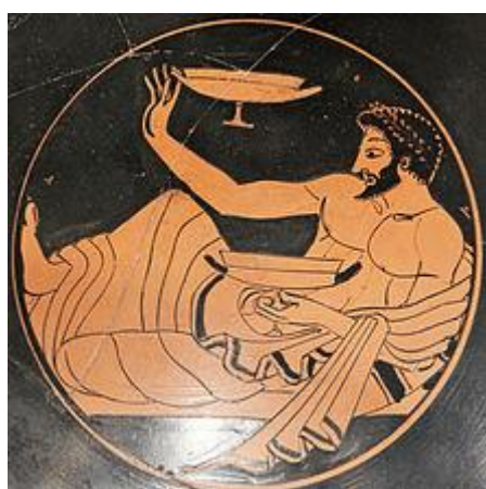
Jeu de cottabe, Metropolitan Museum of Art

- le triclinium, avec mosaïques, fresque, céramiques (jeu du cottabe)