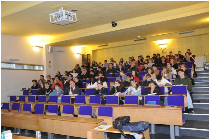
Les Aspirants Chercheurs Mathématiques, leurs accompagnateurs, parents ou professeurs, amphithéâtre Laurent Schwartz