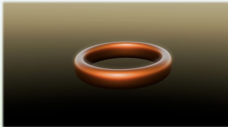
« Tore »