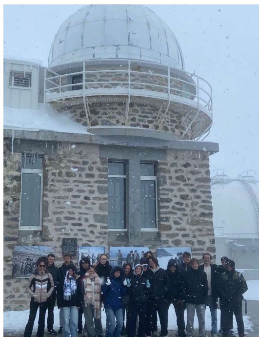
Sortie au Pic du Midi