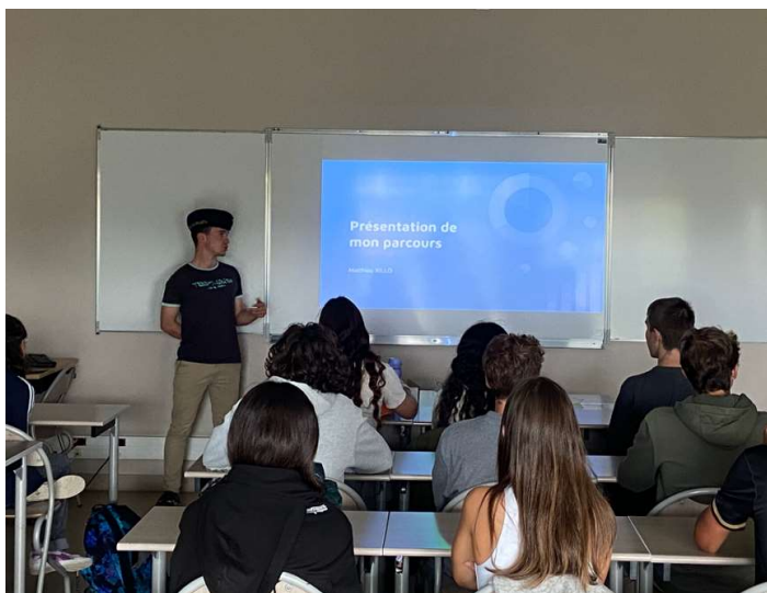
Rencontre avec le parrain du dispositif (présentation de son parcours du lycée jusqu'à Polytechnique)