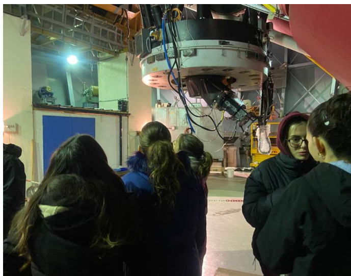
Visite des installations scientifiques de l'observatoire du pic du Midi de Bigorre