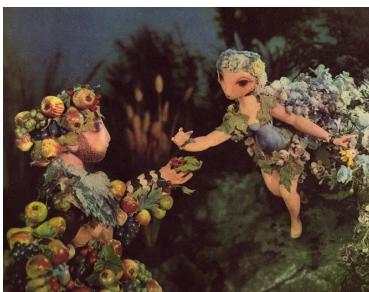
Jiří Trnka : Les Animaux et Les Gens de Petrov - L'Année tchèque - Prince Bayaya - Les Vieilles Légendes tchèques