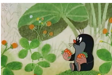
Zdeněk Miler La petite taupe