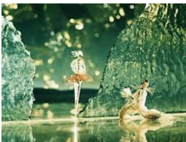
Karel Zeman Rêve de Noël - Voyage dans la préhistoire - Les Aventures fantastiques - Aventures du baron de Münchhausen , Le Baron de Crac - Inspiration (animation verre)