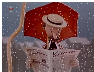
Monsieur Prokhouk détective (1957)